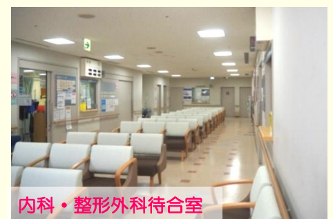
内科・整形外科待合室