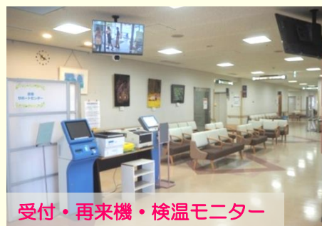
受付・再来機・検温モニター